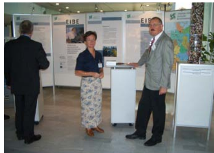
Abb.3: Ausstellungsstand EIBE

Somit ist es nicht erforderlich, ein neues Managementsystem zu installieren, es geht vielmehr um die Nutzung vorhandener Infrastrukturen und der Präzisierung und Optimierung von Eingliederungsprozessen.